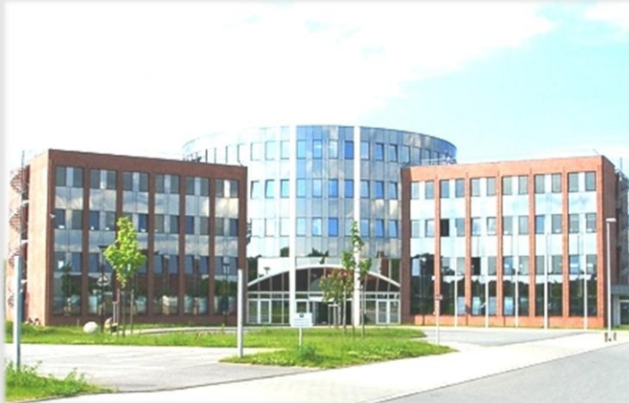
Kieler Wirtschafts-Tower ::: Nordhafen Am Kiel-Kanal 1 – 24106 Kiel